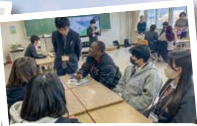
JICA研修員との交流(英語)