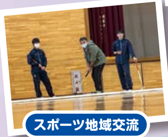
スポーツ地域交流