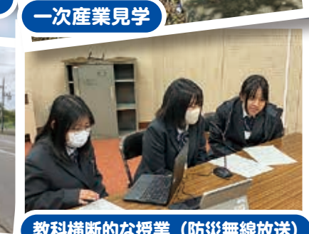
教科横断的な授業(防災無線放送)