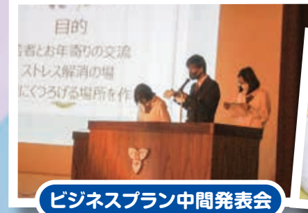
ビジネスプラン中間発表会