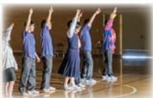
白高祭クラスパフォーマンス