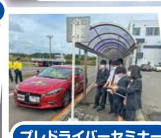
プレドライバーセミナー