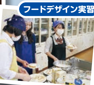
フードデザイン実習