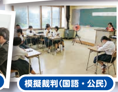
模擬裁判(国語・公民)