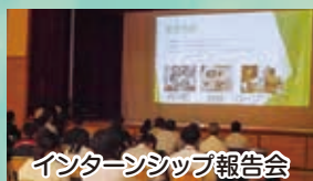
インターンシップ報告会