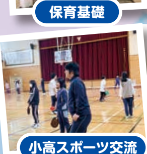
小高スポーツ交流