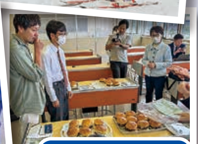
ビジネスプラン試食会