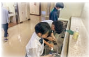
クリーンプロジェクト