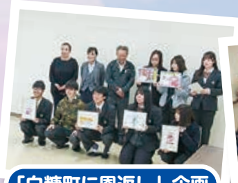
「白糠町に恩返し」企画