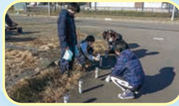
ドリーム部(ボランティア)