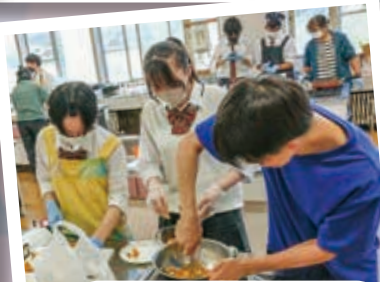
ビジネスプラン試作会