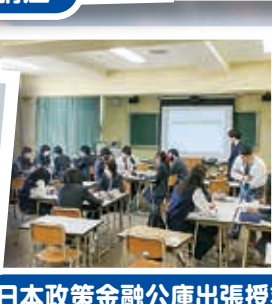
日本政策金融公庫出張授業