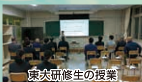
東大研修生の授業