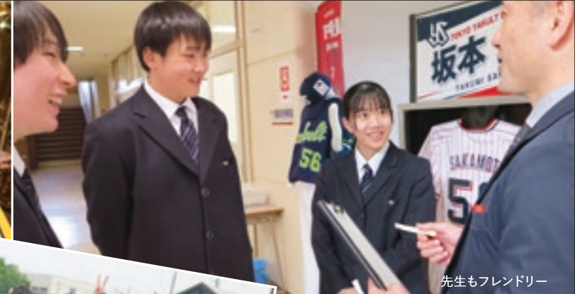
先生もフレンドリー