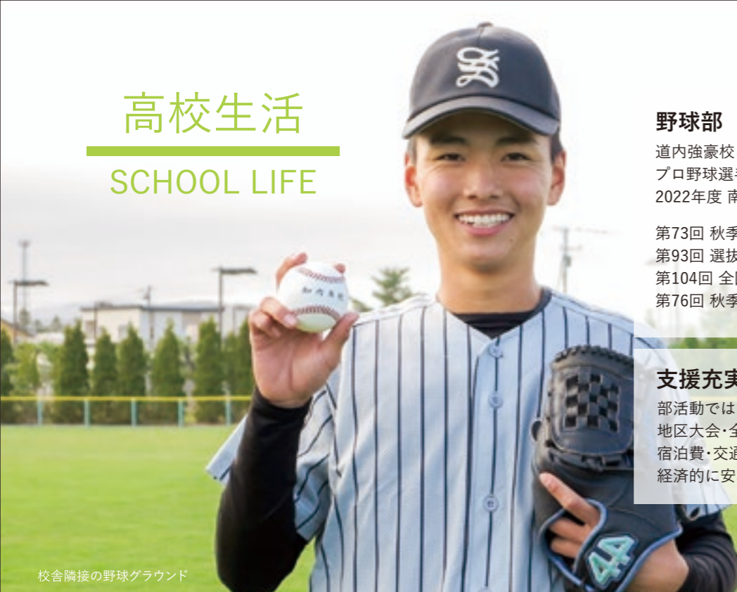
校舎隣接の野球グラウンド