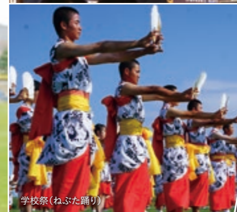
学校祭(ねぶた踊り)