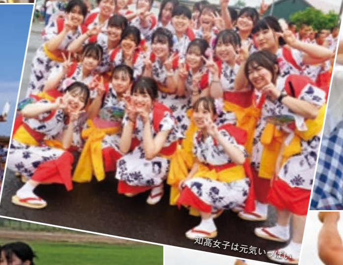
知高女子は元気いっぱい