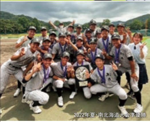
2022年夏・北海道大会準優勝