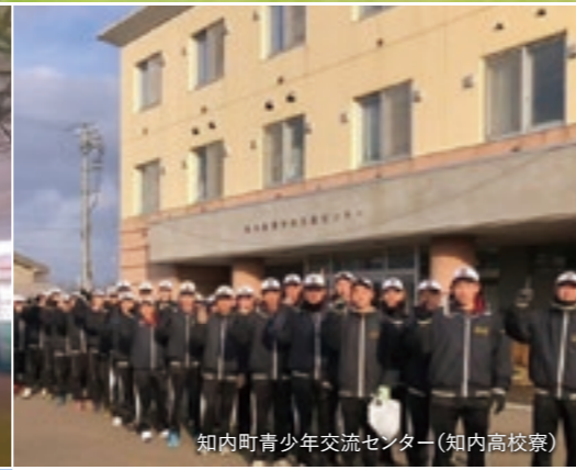
知内町青少年交流センター(知内高校寮)