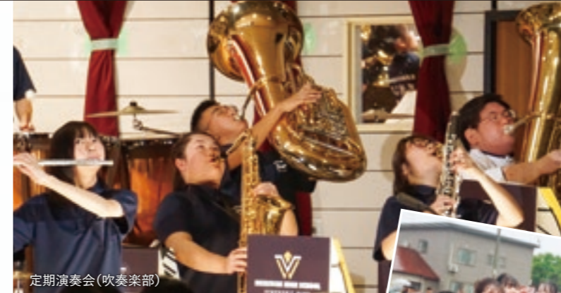
定期演奏会(吹奏楽部)