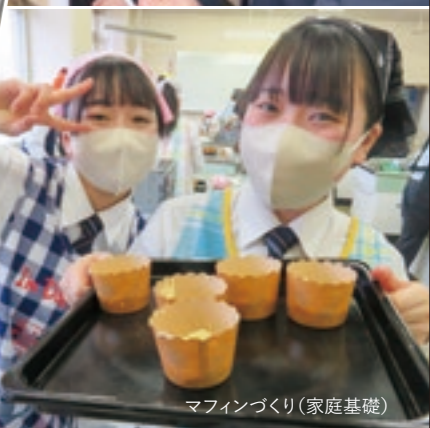
マフィンづくり(家庭基礎)