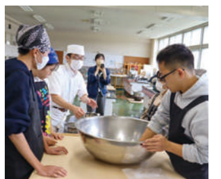
プロを招いての調理実習

本校ではさまざまな体験学習を行っています。安平町ふるさと教育・学社融合推進事業によるミシュランガイド掲載店「そば哲」代表を講師に招いての調理実習や保育園交流、パークゴルフなど、地域の施設や人材と連携して「生きる力」を身につけます。