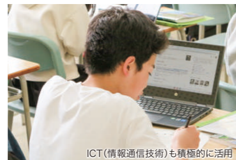
ICT(情報通信技術)も積極的に活用