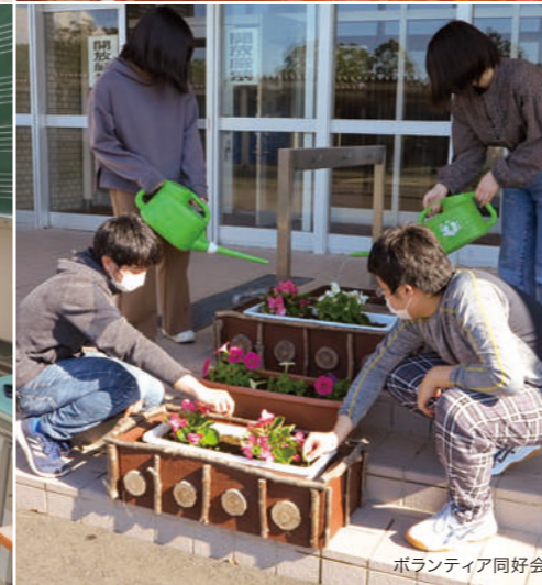
ボランティア同好会