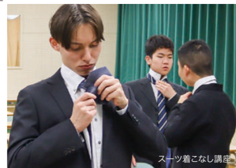
スーツ着こなし講座