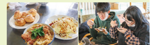
卵料理の数々が完成 地産のおいしさに感動