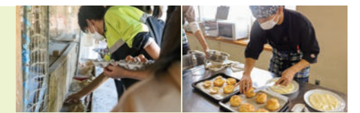
慎重に生みたての卵を集める 皆で料理に奮闘

安平町全体を学習フィールドと捉え、安平町ならではの施設である郷土資料館や鉄道資料館などの見学、安平町で働く人へのインタビュー、安平町特産物である大豆づくりやみそ作りなどの農業体験や加工体験学習を行います。高校3年の選択授業「フードデザイン」の一環として「こころ自然農園」を見学。平飼いで大切に育てている養鶏について、仕事に対するやりがいや課題などを学び、地域理解を深めています。見学後は生産された卵を使用した卵料理にもチャレンジし、楽しい授業にもつなげています。