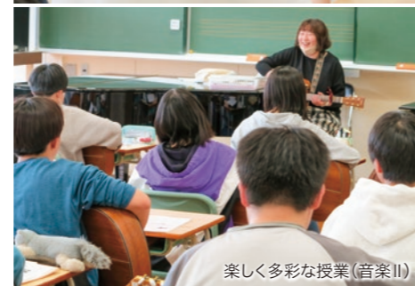
楽しく多彩な授業(音楽II)