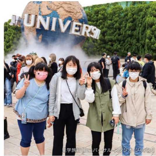
見学旅行(ユニバーサル・スタジオ・ジャパン)