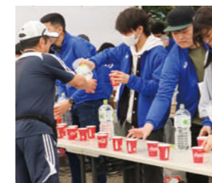
ノーザンホースパークマラソンスタッフ

本校の特色ある教育活動の推進として、安平町の地域に根ざした数多くのボランティア活動に対する取り組みが高く評価され、胆振管内教育実践表彰も受けています。今後も継続的な地域貢献を通じ、豊かな社会性を育てていきます。