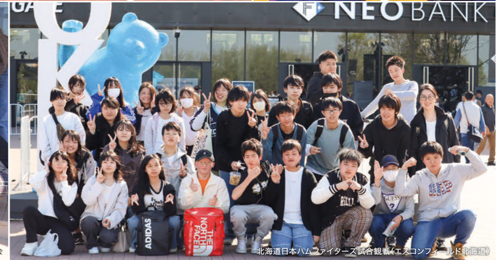
北海道日本ハムファイターズ試合観戦(エスコンフィールド北海道)