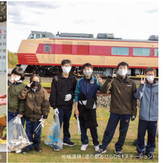
地域清掃(道の駅あびらD51ステーション)