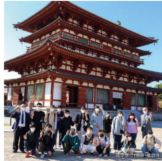
見学旅行(奈良・薬師寺)