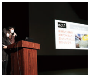
生徒プレゼンテーション

「言語活動の充実」の集大成として、毎年1月に開催。選択科目を中心に、全校生徒に向け学習の成果を披露します。「コンテンツの制作と発信」「フードデザイン」「理数探究基礎」「演奏に親しむ」など多彩な選択科目によるプレゼンテーションがあります。