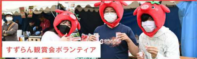
すずらん観賞会ボランティア