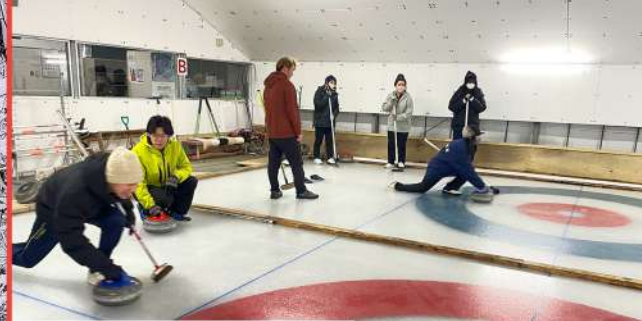
カーリング授業(体育)※町内