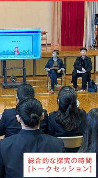
総合的な探究の時間 【トークセッション】