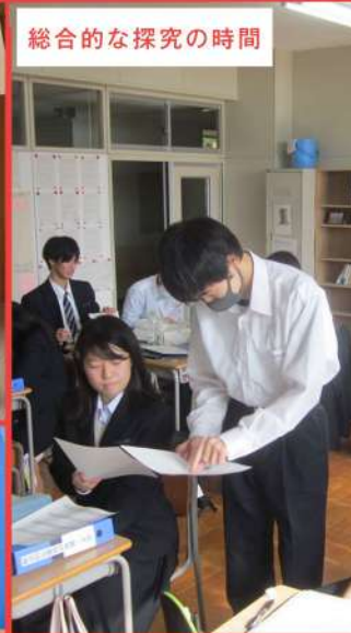
総合的な探究の時間