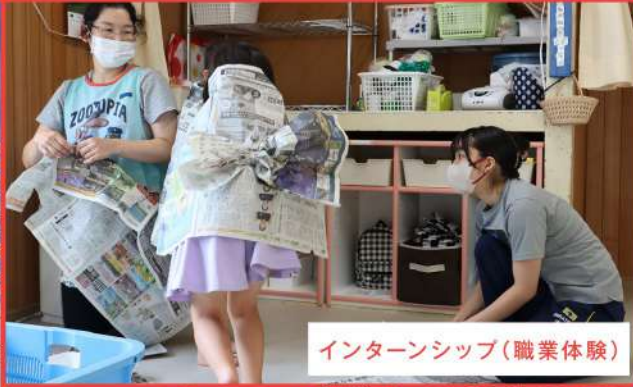
インターンシップ(職業体験)