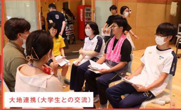
大地連携(大学生との交流)