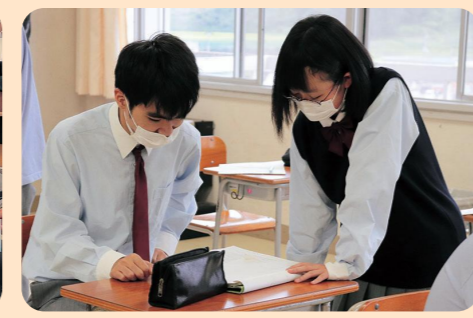
数学の授業は「学び合い」で