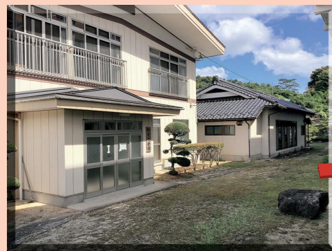
かえで会館(同窓会館)と和室が隣接する