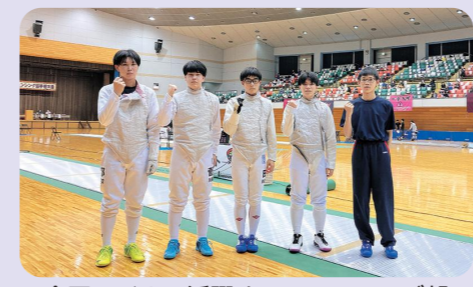
全国レベルで活躍するフェンシング部

令和5年度も進路実現100%を達成しました。令和6年度も一人ひとりの良さを伸ばし可能性を広げながら、生徒全員の進路希望実現を目指します。