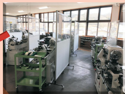
実習室には各種金属加工の機械が設置されている