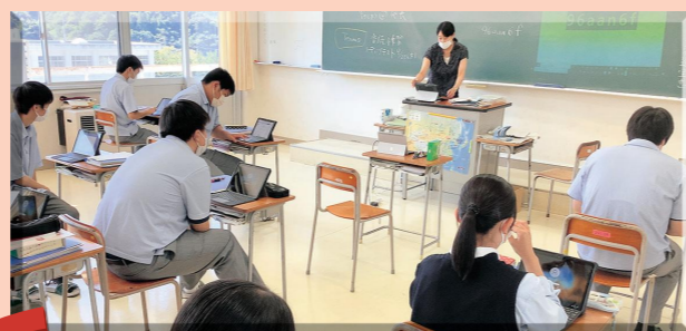
各教室にプロジェクター完備、生徒一人一台端末利用可能