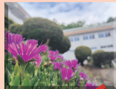
一本一本手入れされた中庭の木々、四季折々の色彩を見せる