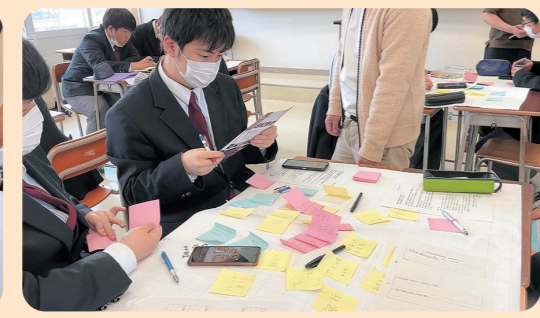
総合的な探究の時間