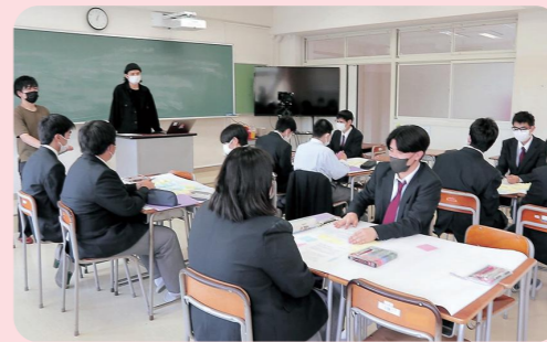
地域の方々を講師に迎えて