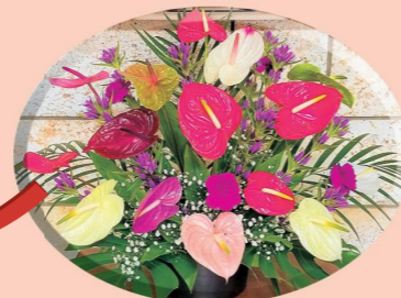
正面玄関には町で栽培されたアンズリウムが飾られる