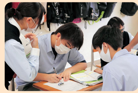
対話をとおして深まる学び