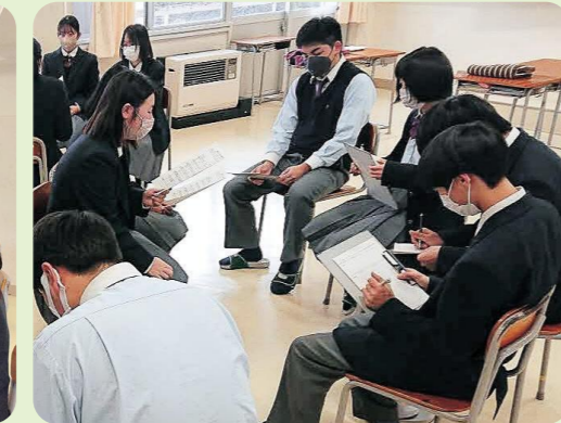
先輩の体験を聞く会