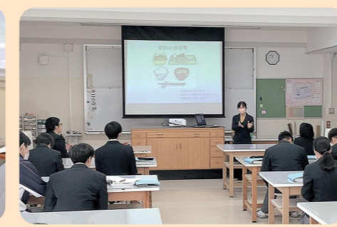
外部講師による特別授業