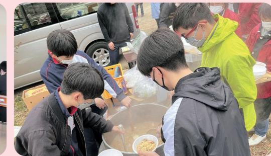
山開きにて豚汁配布のお手伝い

全校生徒と地域の方が一緒に課題を考えたり、時には交流したりと、様々な取り組みを行っています。過去には防災マップ作りを目的とする小島地区フィールドワークを実施し、新聞やテレビでも大きく報道されました。今年度は、地域の方の協力を得ながら、川俣町商店街のPR動画作成と農業体験を総合的な探究の時間に行っています。