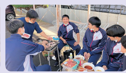
全校バーベキューで親睦を深める