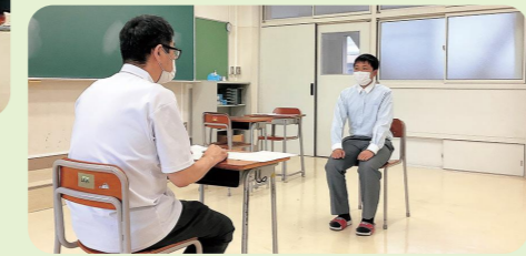
就職に向けた面接指導