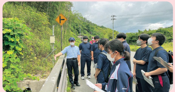
小島地区におけるフィールドワーク