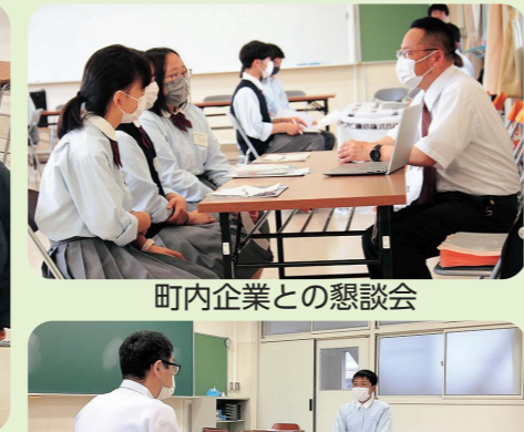
町内企業との懇談会