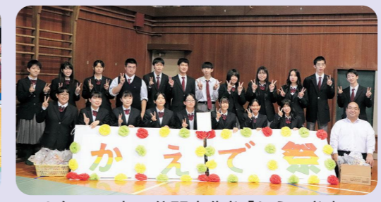
3年に一度の公開文化祭「かえで祭」