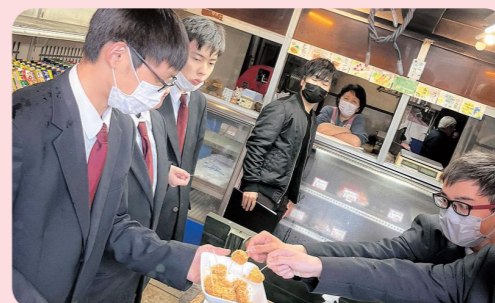
川俣町 PR 動画作成