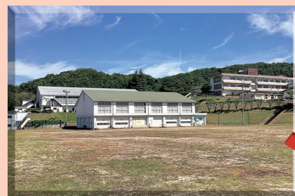
体育館、グラウンドを2つずつ持つ広大な敷地