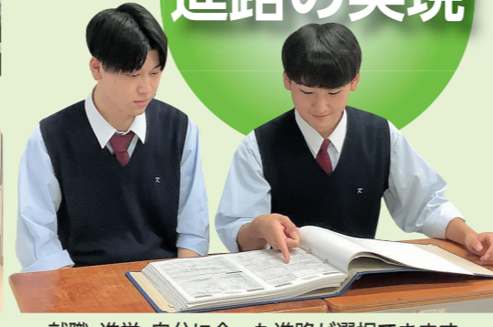
就職・進学、自分に合った進路が選択できます。