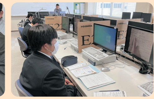
ICT機器を活用した商業科目の授業

基礎、基本を大切にしながらの授業の他、2年次以降は進路希望に応じて工業系、商業系の科目選択も可能です。特に、普通科において工業科目を選択できる県内唯一の高校です。