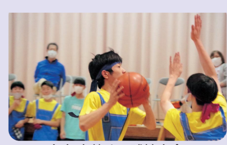
毎年白熱する球技大会