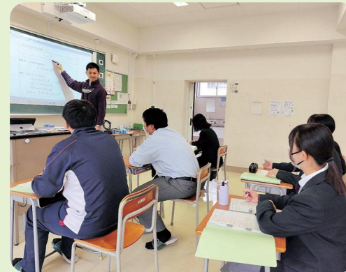
進学希望者対象の課外授業や個人添削指導