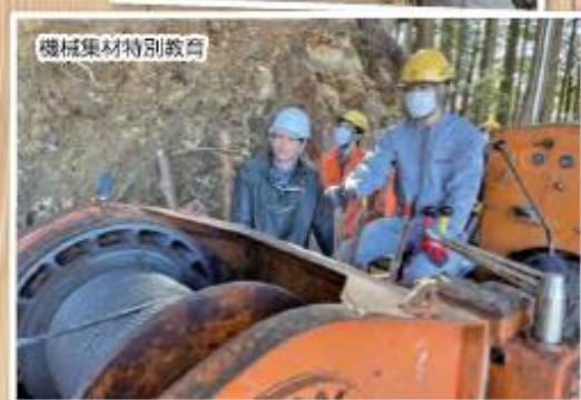
機械集材特別教育