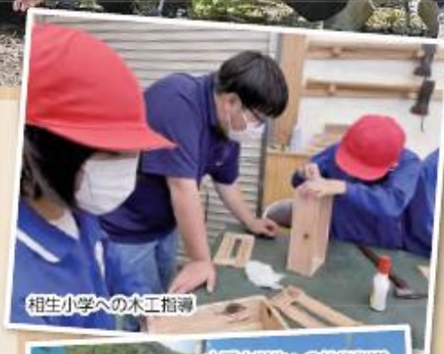
相生小学への木工指導