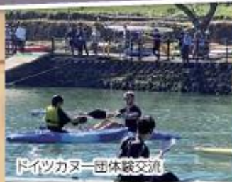
ドイツカヌー団体験交流