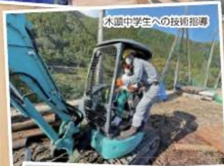
木頭中学生への技術指導