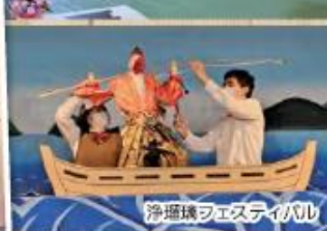
浄瑠璃フェスティバル