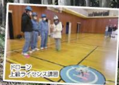
ドローン 上級ライセンス講習