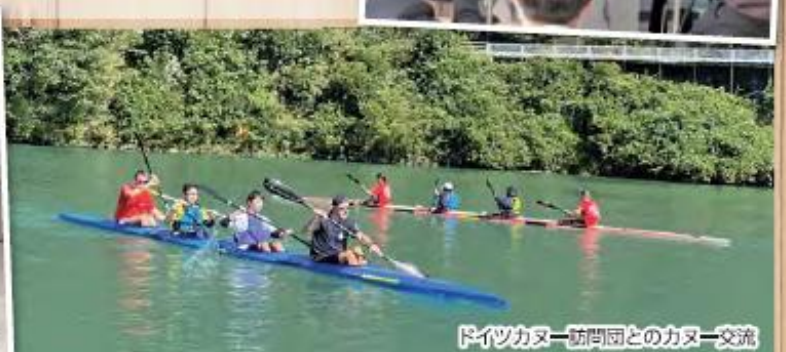
ドイツカヌー訪問団とのカヌー交流