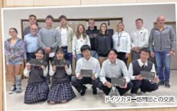
ドイツカヌー訪問団との交流