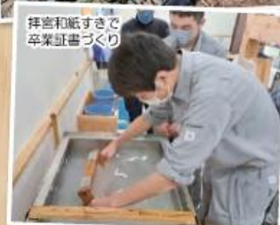
拝宮和紙すきで 卒業証書づくり