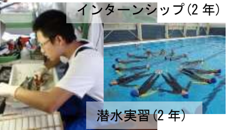
インターンシップ(2年)