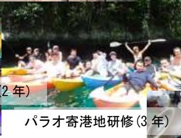
パラオ寄港地研修(3年)