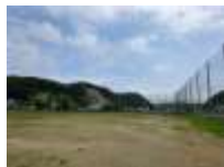
野球・サッカー場