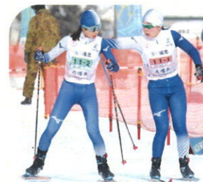
リレーで次走者を激励