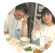
美味しく楽しい夕食