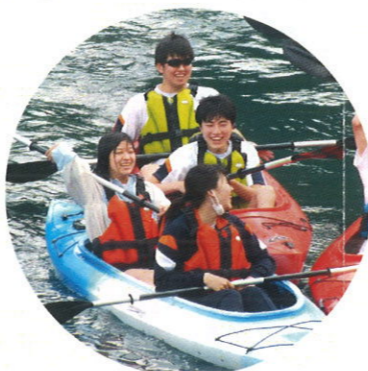
桂湖でカヌー体験