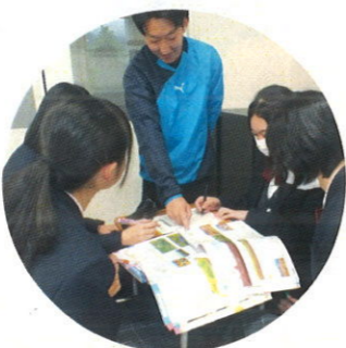
放課後の教室で勉強会