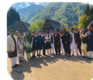
ガイドの後、外国のお客様と記念撮影