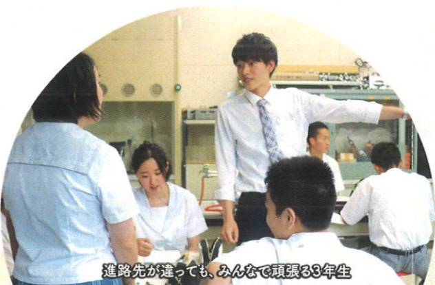
進路先が違って、みんなで頑張る3年生