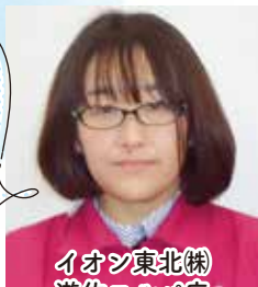
イオン東北(株) 遊佐エルパ店