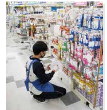
■ インターンシップ