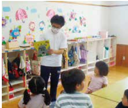
■ ふれあい施設訪問 (産業社会と人間)