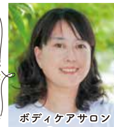
ボディケアサロン Canana