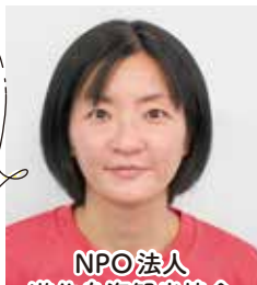
NPO法人 遊佐鳥海観光協会