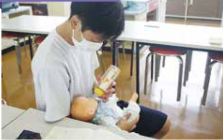
子どもの発達と保育