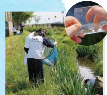
■ フィールドワーク