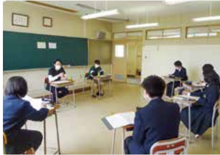
■ 地域で働く人々へのインタビュー

人・地域社会との関わりを大切に、 自分の将来を思い描き、社会で生きていく力を 身につけるためのプログラムです。