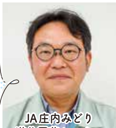
JA庄内みどり 遊佐園芸センター