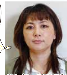
遊佐ブランド推進協議会