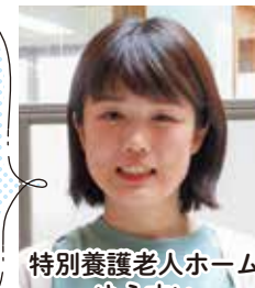
特別養護老人ホーム ゆうすい