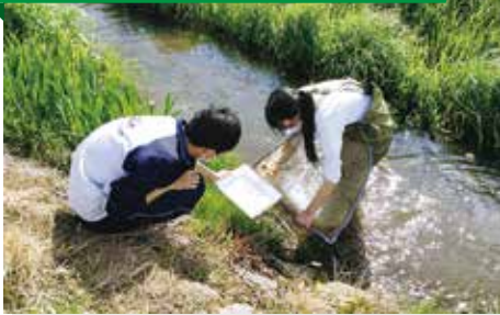
フィールドワーク (総合的な探究の時間)