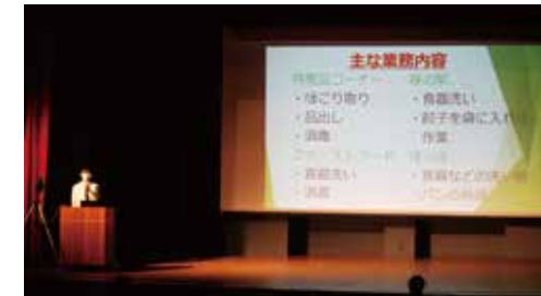
■ デュアル実践発表会