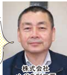
株式会社 ゆぎ食彩工房