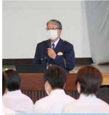
■ やまがたのスペシャリストに 聞くトップセミナー