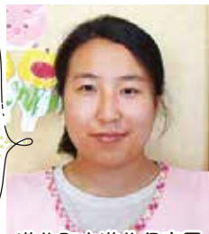
遊佐町立遊佐保育園