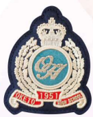
左胸にはOHの エンブレム