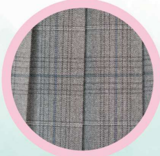
女子はスカート以外に パンツも選択できます