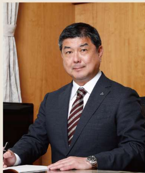
北海道置戸高等学校 校長

一方で、持続可能な福祉社会を担い、これからの日本の福祉を背負って立ち、地域のリーダーとなる多くの人材が本校への入学を希望されるよう最善を尽くしてまいります。