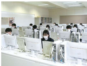
5 コンピューター室