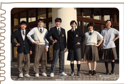
キリッと引き締まる ストライプのリボン