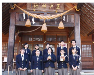
(合格祈願～置戸神社)