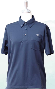
夏季はポロシャツの 着用も可能です (男女共通)