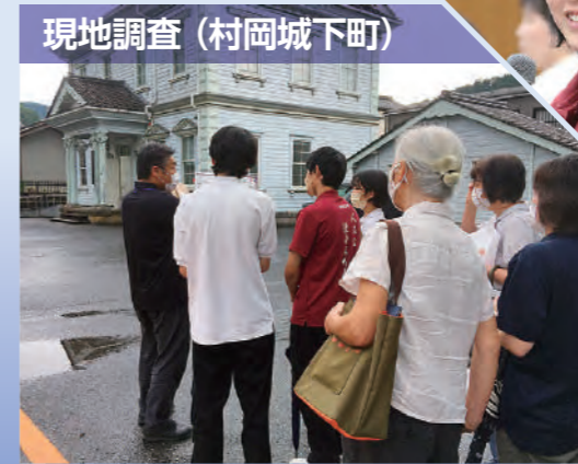
現地調査（村岡城下町）