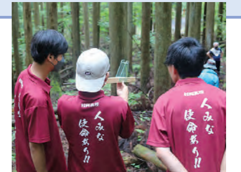
環境B班（森の健康診断）