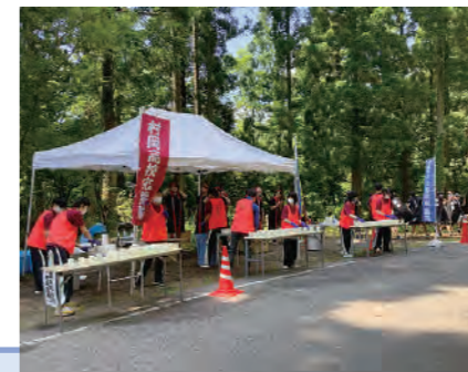
みかた残酷マラソン全国大会