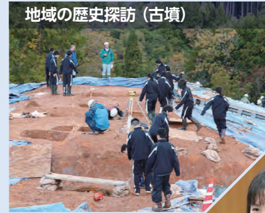
地域の歴史探訪（古墳）

地域を教材として課題発見・比較検証・実践を基礎とした学習活動を行います。課題を見つけ、情報収集、情報発信をする力を身につけることが目標です。大学や社会で必要な問題課題解決力、コミュニケーション力、プレゼンテーション力を育みます。