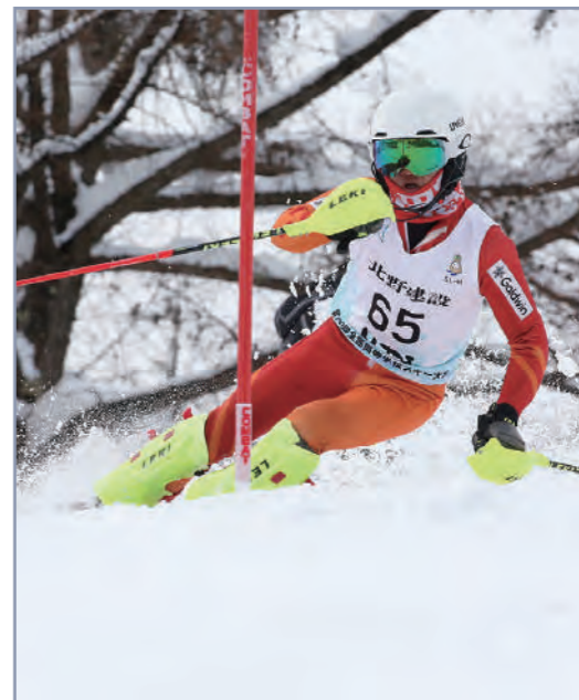
スキー部県総体 男子33連覇(継続中) 女子11連覇