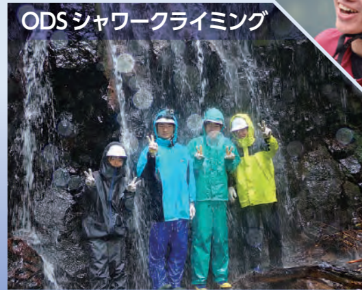
ODSシャワークライミング