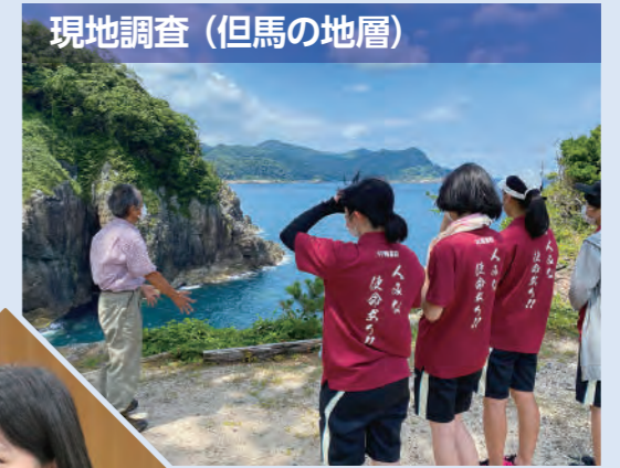
現地調査（但馬の地層）