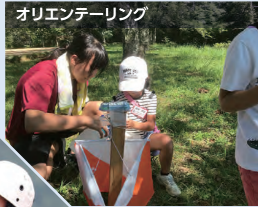
オリエンテーリング