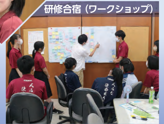
研修合宿（ワークショップ）