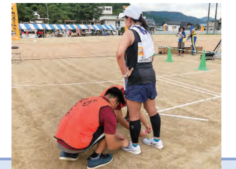
村岡ダブルフルウルトラランニング