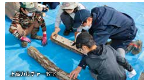
上高カレッジ教室