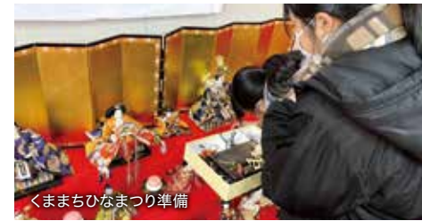
くままちひなまつり準備