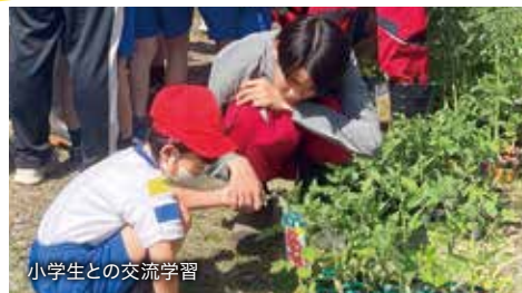
小学生との交流学習