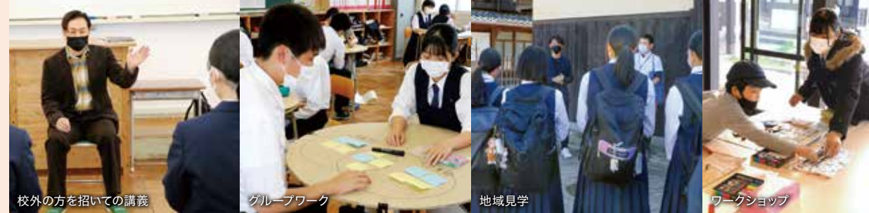
校外の方を招いての講義 グループワーク 地域見学 ワークショップ

地域課題の発見・解決に取り組み、自らの進路や将来について考えています。授業では、地域の方も講師に招いたり、毎回様々な内容の学習に取り組みます。