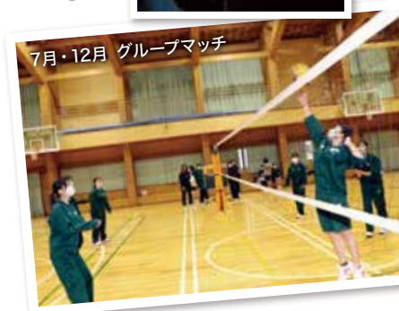
7月-12月 グループマッチ