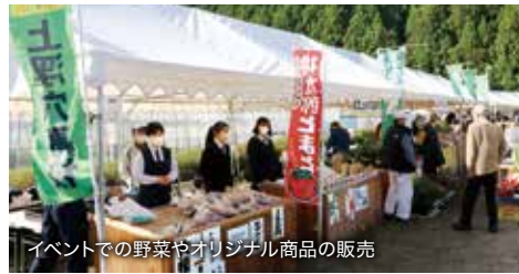
イベントでの野菜や加工商品の販売