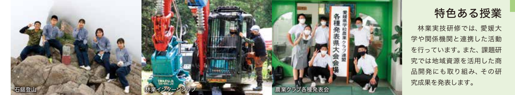
石鎚登山 森林インターンシップ 農業クラブ各種発表会

森林環境科は、森林環境や農業に関する科目を多く学びます。 総合実習 では、2年次から3つの専攻班に分かれ、より専門的な知識や技術を身に付けることができます。また、森林野外活動や木材デザインなどの学校設定科目があり、夏にはサマーキャンプや石鎚登山を行っています。