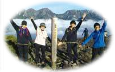
山岳部:蝶ヶ岳山頂