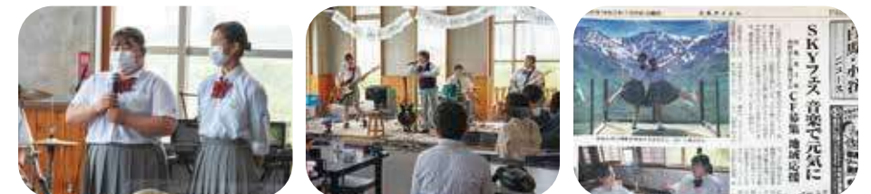
仕掛け人の2人 | 軽音楽部のステージ演奏