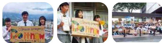
仕掛け人の3人 | マーチ開始前 | 村役場前で集合

気候変動に危機感を覚えた生徒たちの課題意識が地域を巻き込んだ運動に発展し、県内自治体では初となる、白馬村の気候非常事態宣言発出につながりました。