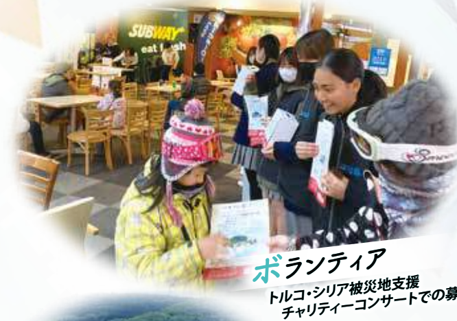
ボランティア トルコ・シリア被災地支援 チャリティーコンサートでの募金活動