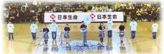
吹奏楽部:信州プレイブウォリアーズのホーム戦でオープニングアクト