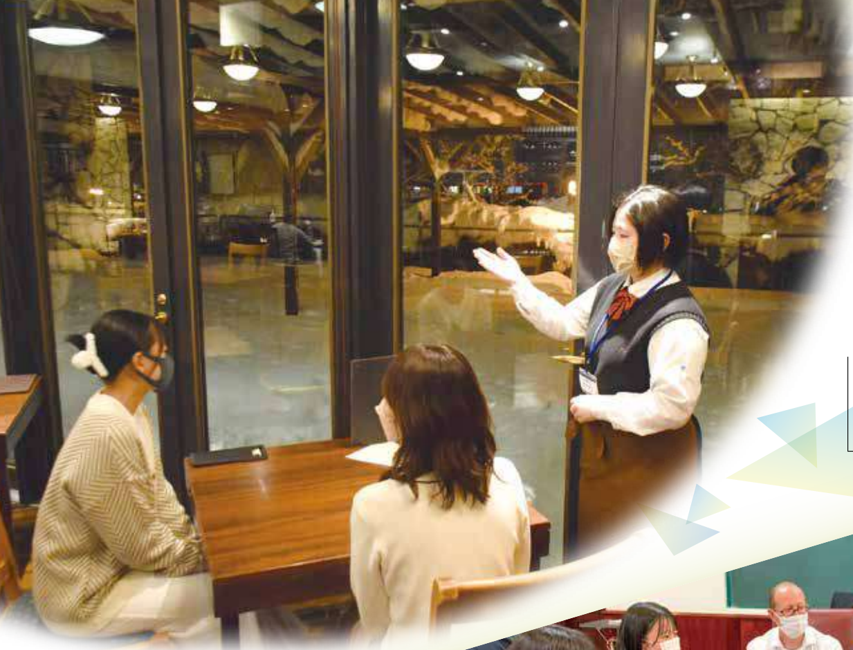
高校生ホテル実習