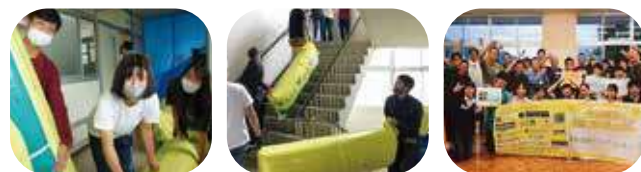
プロジェクトを主催した3人 | 資材の運び込み | 作業したみんなで記念撮影

「環境に配慮した学習空間づくり」として白馬SDGsラボ、大学教授、地域、多くの方々が生徒が協力して、教室の断熱改修を行いました。