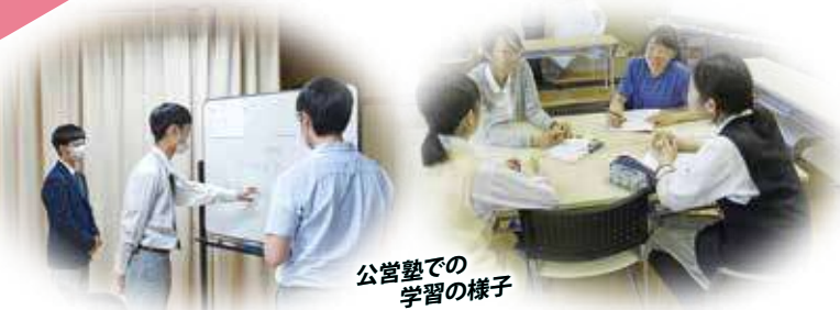
公営塾での 学習の様子