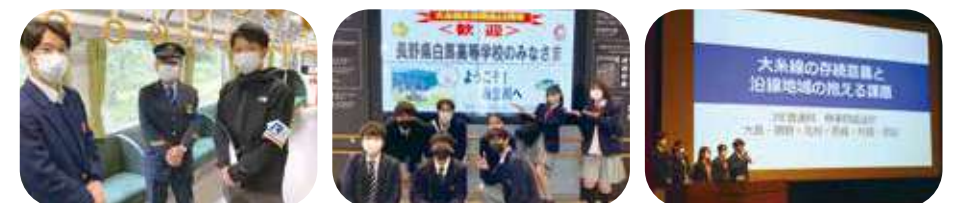
JR西日本の方へインタビュー | 歓迎していただきました | 白馬フォーラムで発表

白馬村・小谷村を結ぶJR大系線は廃線の危機に直面しています。フィールドワークを行い、その結果を踏まえ、高校生の視点から大系線の利活用促進案を考えました。