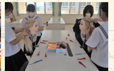
職業理解ガイダンス