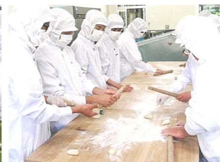
ロールパンの製造