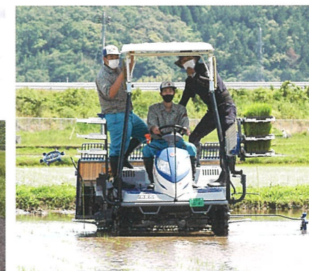
スマート農業による田植え