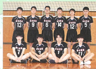
男子バレーボール部