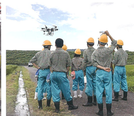
ドローンによる薬剤散布