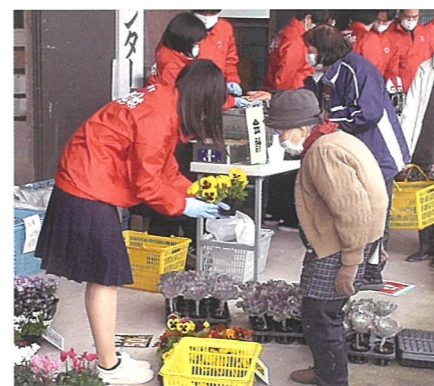
販売実習を通じた地域住民との交流

生産やマーケティングについて総合的に学習し、より一層の付加価値をつけるとともに、安全に流通させるための能力や態度を育成する。