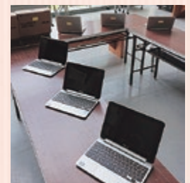
校内で使用できるノートパソコンを90台保有

本校では学習支援システムClassiを導入しています。パソコンやスマートフォン等を用いて、生徒一人ひとりが日々の学習活動や部活動・課外活動の振り返りを行い、教員からのフィードバックを得ることができるほか、システム内で提供されている学習動画やドリルなどを活用して自主的に学習を進めたりすることができます。