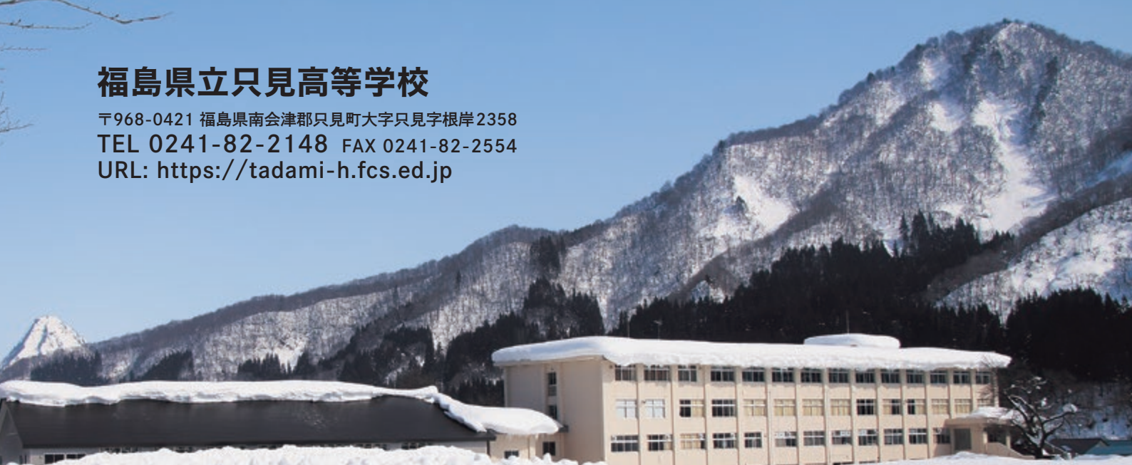
冬の只見高校校舎遠景

〒968-0421 福島県南会津郡只見町大字只見字根岸2358 TEL 0241-82-2148 FAX 0241-82-2554 URL: https://tadami-h.fcs.ed.jp