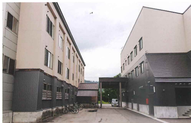
奥会津学習センターでは、男子寮(左)と女子寮(右)が向かい合って立っています。