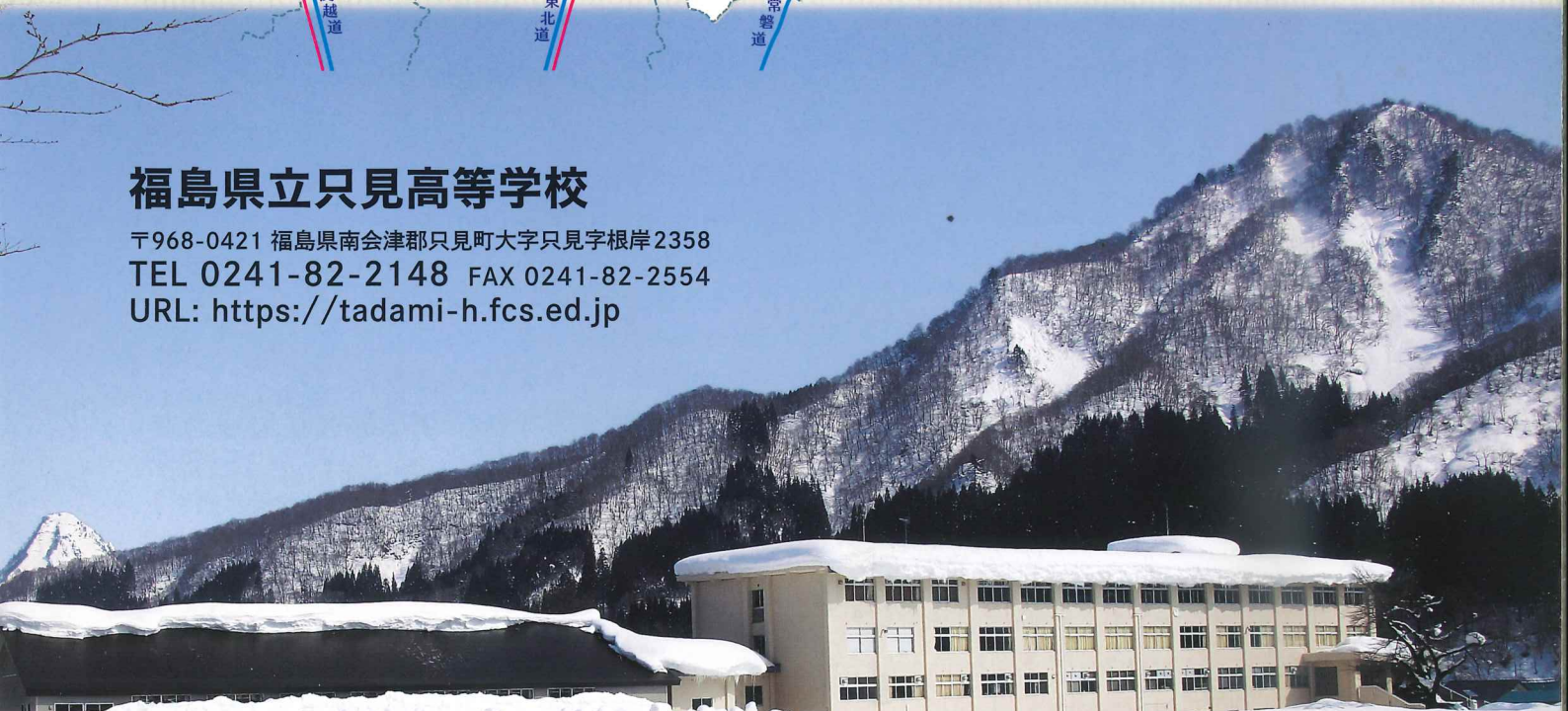
冬の只見高校校舎遠景

〒968-0421 福島県南会津郡只見町大字只見字根岸 2358 TEL 0241-82-2148 FAX 0241-82-2554 URL: https://tadami-h.fcs.ed.jp