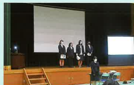
プロジェクト発表会