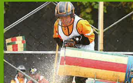
伐木チャンピオンシップ