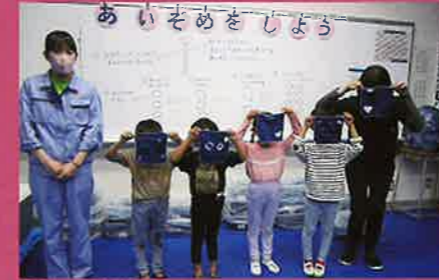
園児との鑑賞交流