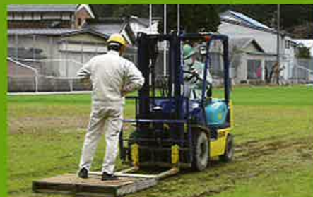
フォークリフトの実習