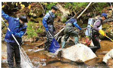
ブラウントラウトボランティア

智頭農林高校では地域で学ぶ専門高校として、智頭町全体をフィールドにたくさんの活動を行ってきました。今もその取り組みが脈々と受け継がれています。町全体の93%が森林である大自然とそこに暮らす人々のあたたかさに触れて、“のうりん生”は成長していきます。