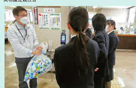
ボランティア活動