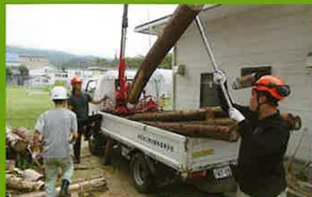
丸太の運搬作業実習