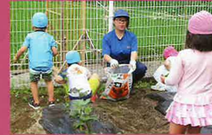
園児との菜園交流