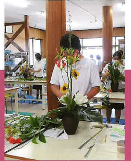
フラワーアレンジメント制作