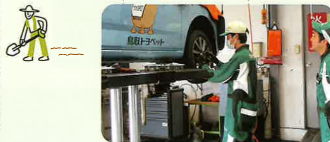
インターンシップ