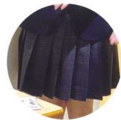
おしゃれなグレーのチェック柄