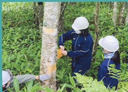
フィールドワーク

生徒の個性を大切にしている池田高校では、ユニークな授業もたくさん！！大人でも経験できないような事が授業の中で行われます。*年によって実施されないものもございます