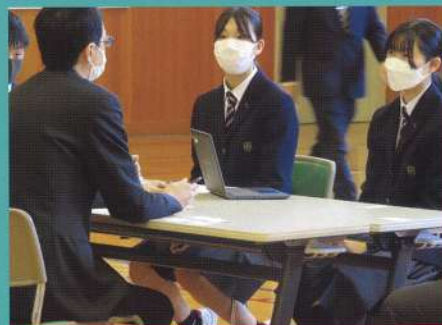
地域人インタビュー