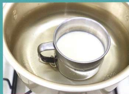
地元大豆を使った豆腐作り