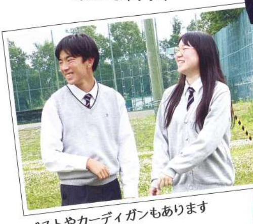
ベストやカーディガンもあります