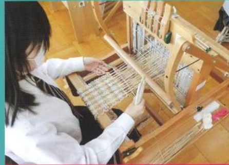
池田町産羊毛で織物