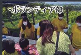
・ボランティア部