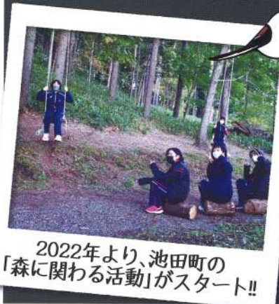
2022年より、池田町の「森に関わる活動」がスタート!!