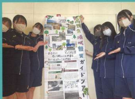
高校生ガイドツアー企画