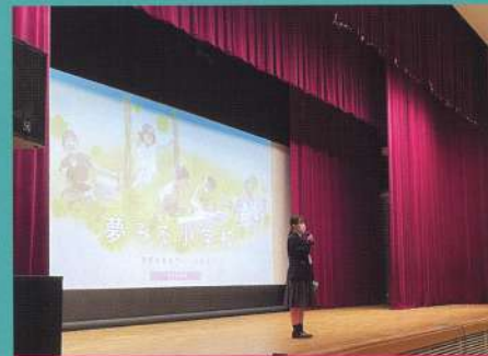
自分の興味ある探究学習