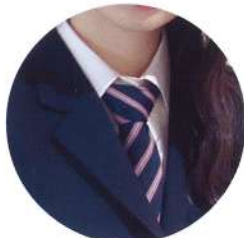
K-POPアイドルみたいなネクタイ