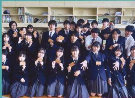
池田町エゾシカ皮での名刺ケース作り