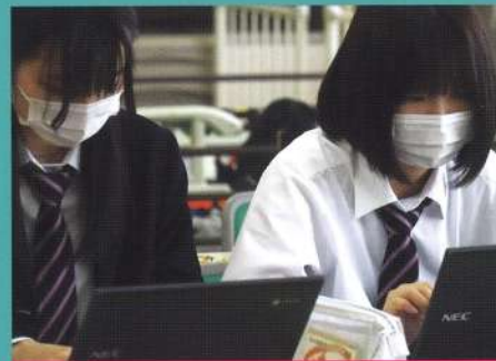
デジタル端末を使った授業