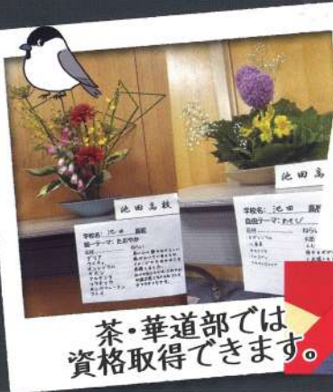
茶・華道部では資格取得できます。