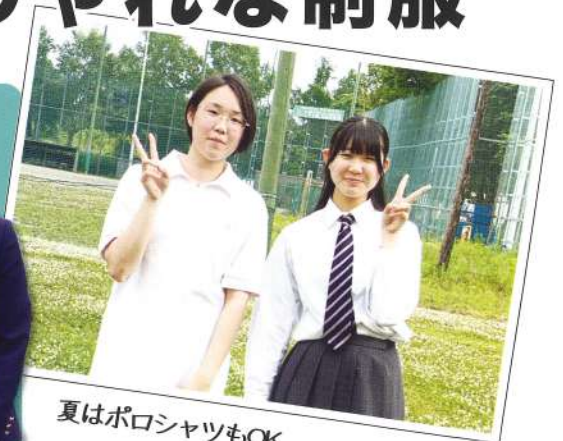
夏はポロシャツもOK