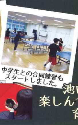
中学生との合同練習もスタートしました。