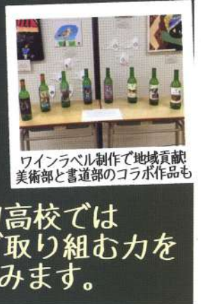
ワインラベル制作で地域貢献!美術部と書道部のコラボ作品も