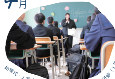
始業式・入学式・新入生歓迎会・校外清掃・宿泊研修(1年生)