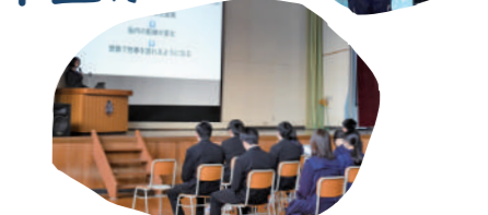
未来計画活動報告会