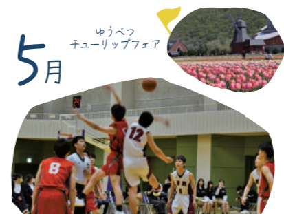
遊藝訓練・生徒総会・壮行会・高体連集約大会