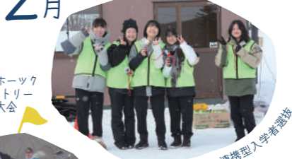
湧別原野オホーツククロスカントリースキー大会