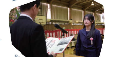
卒業式・生徒総会・連携型一般入学者選抜・修了式