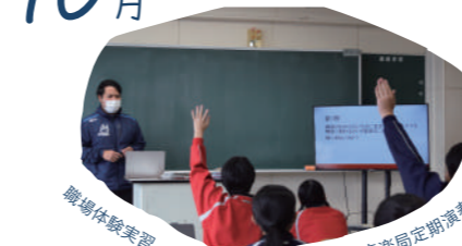
職場体験実習(2年生)・技能体育祭・吹奏楽局定期演奏会