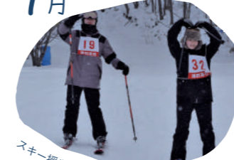
スキー授業(1・2年)・3年生を送る会