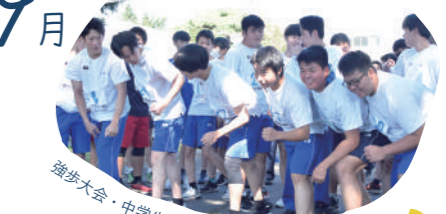
強歩大会・中学生体験入学