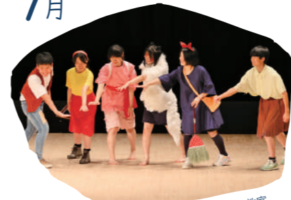
湧虹祭(ゆうこうさい)・交通安全教室