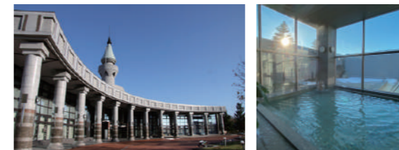
上：外観イメージ（2025年4月時点）/ 左下：徒歩3分の距離にある文化センターでは定期的に催しがあり、賑やかです。/ 右下：天然温泉の「チューリップの湯」は町民いこいの場。

新築の学生寮は町の中心部に位置し、学校まで徒歩12分ほどの距離。無印良品の家具を導入し、シンプルで機能的な生活空間を整備しています。また、周辺には図書館を備えた文化センター、温泉、病院、飲食店などがあり、生活に便利な立地です。 全室トイレ・シャワー室付き（バリアフリー室はユニットバス）で、食堂兼談話室、学生用ラウンジなどを完備。ハウスマスターが寮での生活をサポートします。