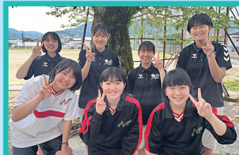
バスケットボール部 (男子)

明るく、仲良く毎日楽しく部活をしています。初心者の方でも大歓迎！ぜひ私たちと一緒にバスケットをしましょう！