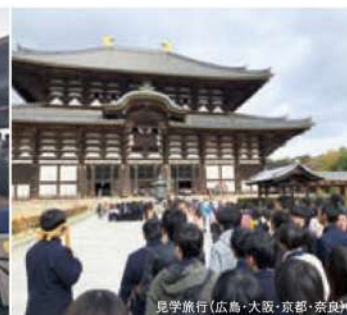
見学旅行(広島・大阪・京都・奈良)