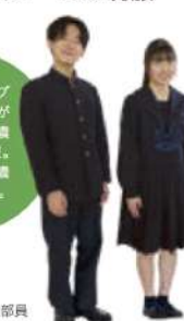
モデル：生徒会執行部員

女子はシャープな襟にリボンがアクセントの濃紺セーラー服。男子は精悍な濃紺詰着学生服。