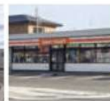
セイコーマート(コンビニ)