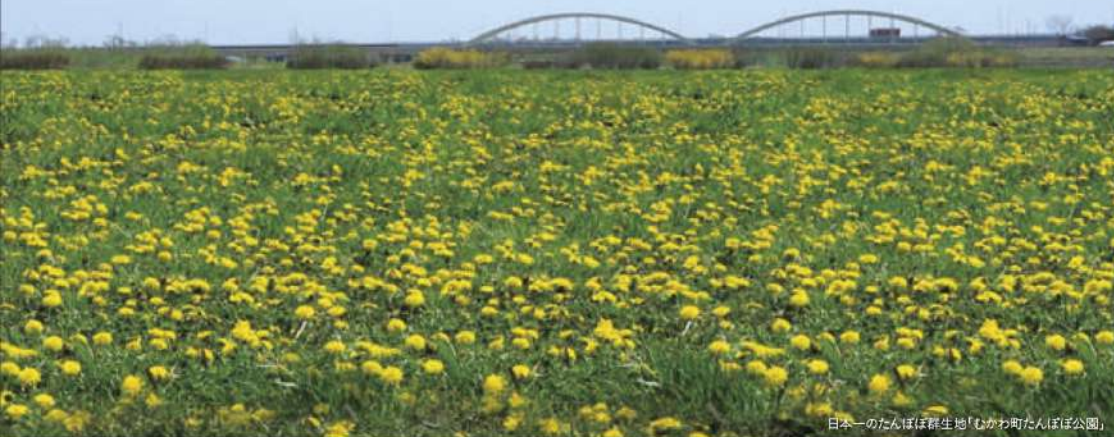
日本一のたんぼほほ緑生地「むかわ町たんぼ公園」