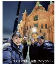
ウスベンスキー寺院(フィンランド)

フィンランドにあるアラヤルヴィー高校と相互交流・訪問をしています。オンラインでも継続的に交流を図っており、異文化交流や言語交流も盛んです。また、希望者はむかわ町の補助の元、オーストラリアに短期留学することができます。 ※オーストラリア短期留学はむかわ町に在住している生徒が対象