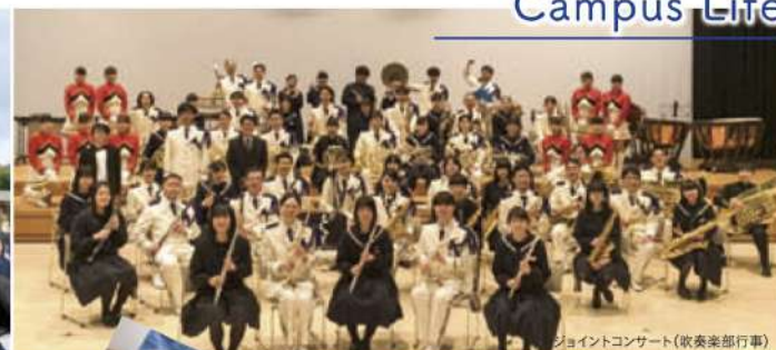
ジョイントコンサート(吹奏楽部行事)