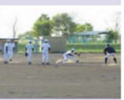
甲子園と同じサイズの専用球場