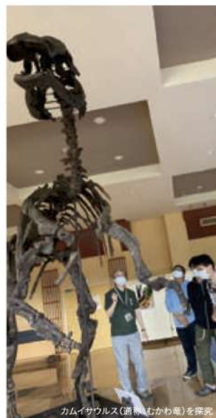
カムイサウルス(通称むかわ竜)を研究