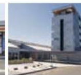
道の駅「四季の郷」(宿泊・温泉施設有)