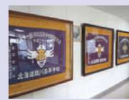
燦然と輝く選抜旗

部員の技術向上と人間形成のためのさまざまなサポートをはじめ、全国でも屈指の練習環境を整備しています。