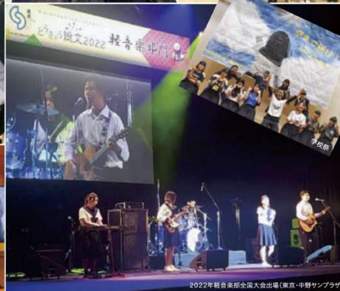
2022年軽音楽部全国大会出場(東京・中野サンプラザ)