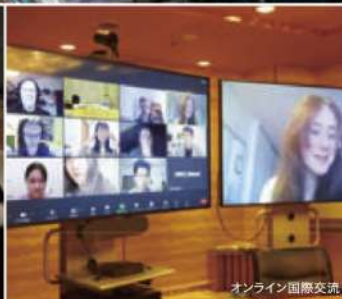
オンライン国際交流