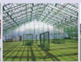
冬も暖かい室内練習場