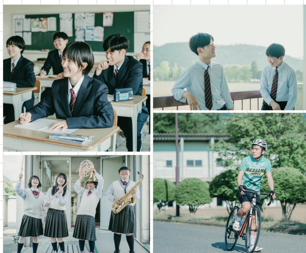
Oh-hasama school days